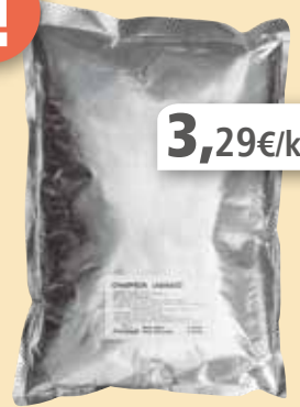
Ref.: 1100001644 EUROCHAMP Xampinyó laminat 3 kg