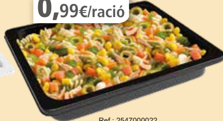
Ref.: 2547000022 CARRETTILLA Amanida de pasta amb tonyina 1,8 kg 2 u.