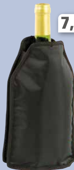
Ref.: 8390000039 KOALA Funda refredadora High Tech