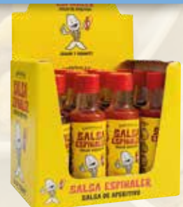
Ref.: 2123000018 Salsa per a aperitius 92 ml 12 u.