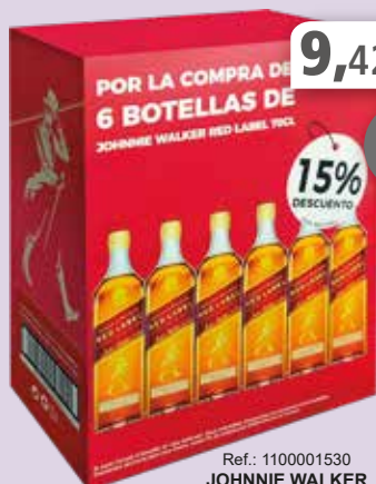
Ref.: 1100001530 JOHNNIE WALKER Red Label whisky 70 cl 6 u. + 15% dte.