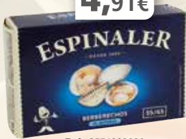
Ref.: 2551000006 Escopinyes al natural OL120, 55/65 F.O.