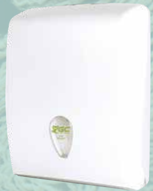
Ref.: 7409000010 GC-NATURE Tovalloles de mà 230 x 200 mm 20 u. 196 serveis