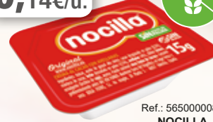
Ref.: 5650000085 NOCILLA Crema al cacau amb avellanes 15 g 72 u.