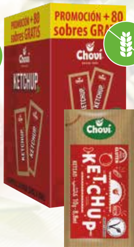
Ref.: 1100001325 CHOVÍ Quètxup 172 sobres de 10 g + 80 sobres de 10 g gratis