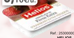
Ref.: 2530000086 HELIOS Mermelada de maduixa 25 g 250 u.