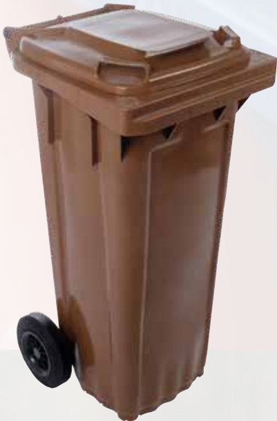
Ref.: 8394000011 Contenidor mòbil marró amb tapa 93,5 x 45 x 51,5 cm 80 l