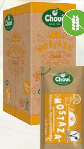
Ref.: 2121000100 CHOVÍ Mostassa groga 378 sobres de 5 g