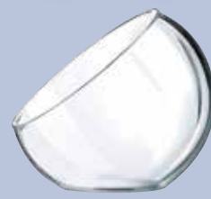
Ref.: 1100000802 ARCOROC Versatile copa per a gelat 4 cl 6 u.