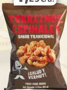
Ref.: 1100001472 Rostes sabor tradicional 60 g 12 u.