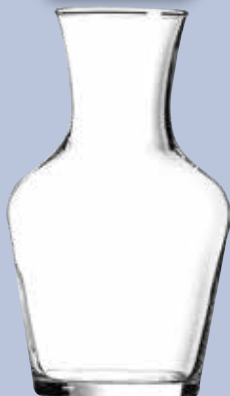
Ref.: 1100000787 LUMINARC Ampolla per a vi sense tap 0,5 l 12 u.