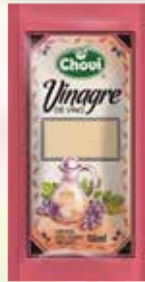
Ref.: 2107510101 CHOVÍ Vinagre de vi en sobres 10 ml 250 u.