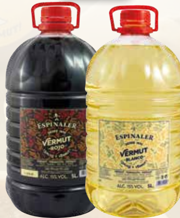
Ref.: 1130000025 o 1130000038 Vermut negre o blanc 5 l