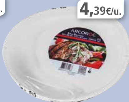
Ref.: 1100000798 ARCOROC Solution plat per a carn 30 x 26 cm 6 u.