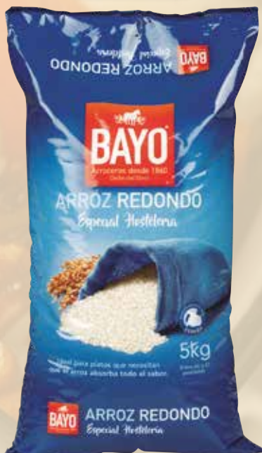
Ref.: 2711000521 BAYO Arròs extra 5 kg