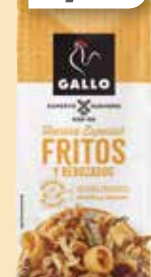
Ref.: 2713000025 Farina per a fregits 1 kg