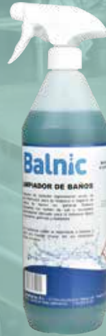
Ref.: 7723000051 BALNIC Netejador de banys 1 l