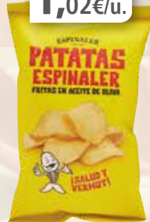
Ref.: 5002000031 Patates fregides en oli d'oliva 50 g 25 u.