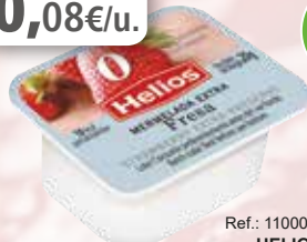
Ref.: 1100000728 HELIOS Diet mermelada de maduixa sense sucres afegits 20 g 80 u.