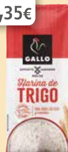
Ref.: 2713000026 Farina extra 1 kg