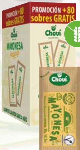
Ref.: 1100001324 CHOVÍ Maionesa 172 sobres de 10 g + 80 sobres de 10 g gratis