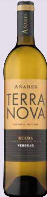
Ref.: 1100001137 ANARES Terranova vi blanc Verdejo 2024 D.O. Rueda 75 cl

5+1 Per la compra de 5 amp. Yzaguirre, REGAL d'1 amp. Terranova