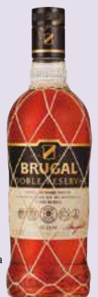
Ref.: 1100001271 BRUGAL Rom doble Reserva 70 cl