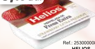
Ref.: 2530000084 HELIOS Mermelada de maduixa 25 g 80 u.