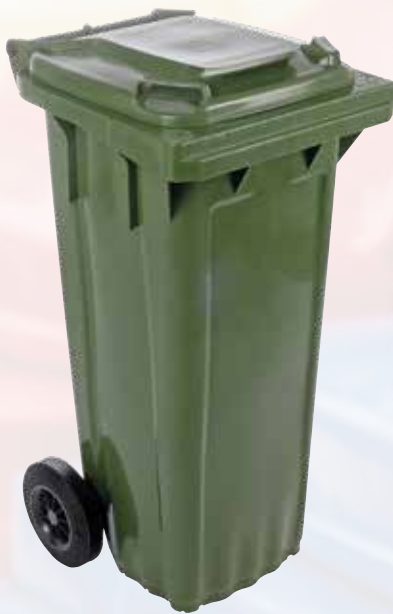
Ref.: 8394000010 Contenidor mòbil verd amb tapa 93,5 x 45 x 51,5 cm 80 l