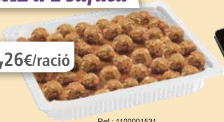
Ref.: 1100001531 CARRETTILLA Mandonguilles amb salsa Bordelesa 2 kg 2 u.