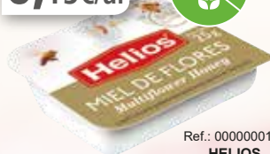
Ref.: 0000000116 HELIOS Mel de flors 25 g 80 u.