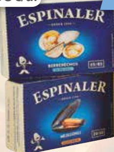
Ref.: 2551000039 Pack Garbí 12 u.

Per la compra d'1 pack Garbí, REGAL d'1 caixa de Salsa Espinaler