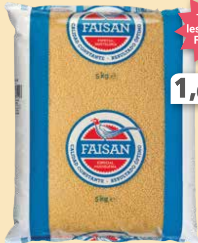
FAISAN Pasta 5 kg