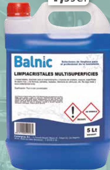
Ref.: 7723000036 BALNIC Netejavidres multiús 5 l