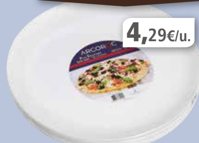
Ref.: 8353000013 ARCOROC Solution plat per a pizza 32 cm 6 u.