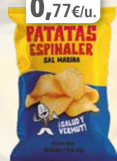
Ref.: 1100000443 Patates fregides amb sal marina 50 g 25 u.