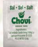
Ref.: 1100000936 CHOVÍ Sal sobres de 0,8 g 2000 u.