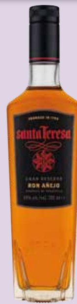
Ref.: 1115253400 SANTA TERESA Rom anyenc Gran Reserva 70 cl