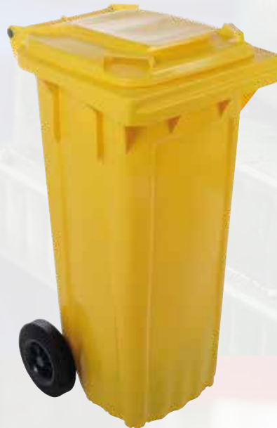
Ref.: 8394000013 Contenidor mòbil groc amb tapa 93,5 x 45 x 51,5 cm 80 l