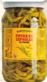
Ref.: 1100001110 Piparras bitox en vinagre 700 g