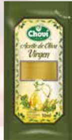
Ref.: 1905810101 CHOVÍ Oli d'oliva verge extra en sobres 10 ml 250 u.