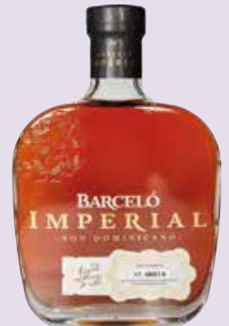
Ref.: 1115343408 BARCELÓ Rom Imperial 70 cl

5+1 Per la compra de 5 amp. variades, REGAL d'1 amp. Brugal anyenc (màx. 3 promós per client)