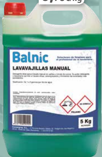
Ref.: 7727000022 BALNIC Rentavaixelles manual 5 kg