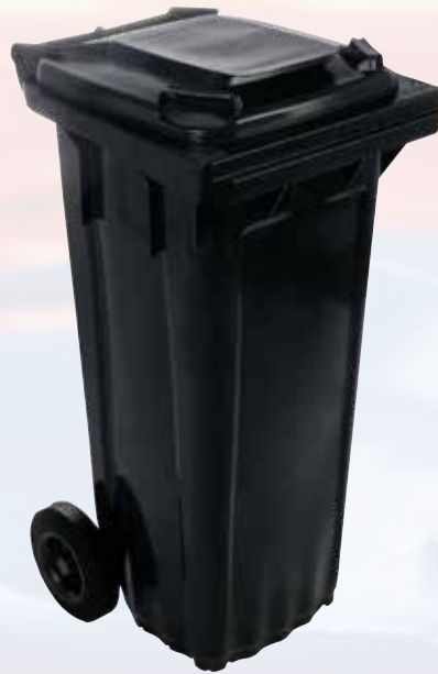
Ref.: 8394000012 Contenidor mòbil negre amb tapa 93,5 x 45 x 51,5 cm 80 l