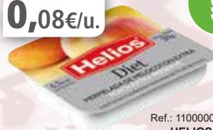
Ref.: 1100000310 HELIOS Diet mermelada de préssec sense sucres afegits 20 g 80 u.