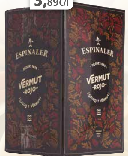
Ref.: 1100000460 Vermut negre bag in box amb aixeta 10 l