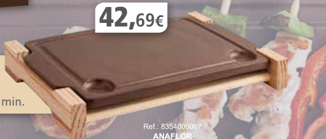
Ref.: 8354000007 ANAFLO Vulcano pedra fang amb suport de fusta 36,5 x 24 cm