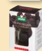
Ref.: 1100000538 AMALUR Tòfona negra sencera 10 g