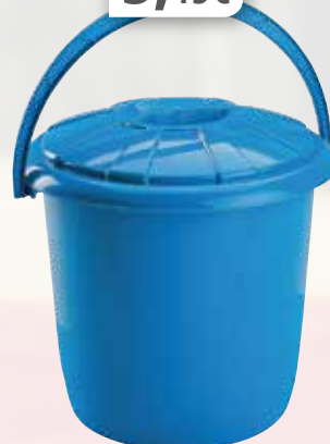
Ref.: 8387000029 RESSOL Cubell d'escombraries domèstic amb tapa 15 l