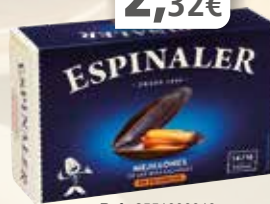
Ref.: 2551000019 Musclos en escabets OL120, 14/16 F.O.