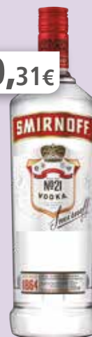
Ref.: 1125113400 SMIRNOFF Red vodka 1 l