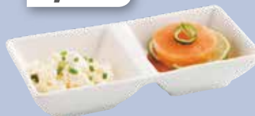
Ref.: 8354000013 QUID Select platet doble 15 x 7 cm 12 u.