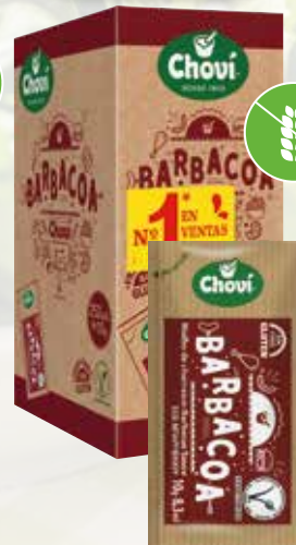
Ref.: 2121000006 CHOVÍ Salsa barbacoa 252 sobres de 10 g