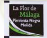
Ref.: 1100001282 LA FLOR DE MÁLAGA Pebre sobres de 0,2 g 1000 u.