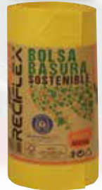
Ref.: 1100000863 RECIFLEX Bosses d'escombraries grogues G-90, 85 x 105 cm 10 u.