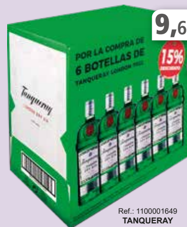
Ref.: 1100001649 TANQUERAY Ginebra London Dry Premium 70 cl 6 u. + 15% dte.