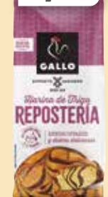
Ref.: 2713000027 Farina per a rebosteria 1 kg