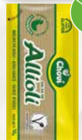
Ref.: 2121000082 CHOVÍ Salsa allioli 252 sobres de 10 g