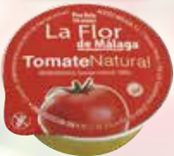
Ref.: 1100001042 LA FLOR DE MÁLAGA Tomàquet natural 25 g 30 u.