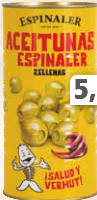
Ref.: 2307000010 Olives farcides d'anxova 600 g F.O.