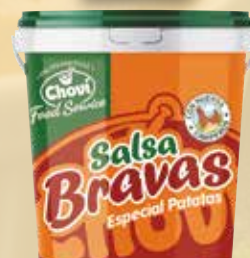
Ref.: 2123070318 CHOVÍ Salsa Brava 1,85 kg