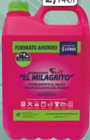
Ref.: 1100001213 EL MILAGRITO Desengreixant 5 l