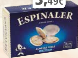
Ref.: 2551000016 Cloïsses fines al natural OL120, 15/20 F.O.