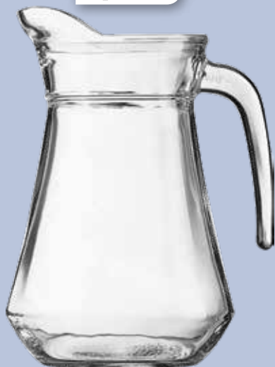
Ref.: 8001000242 LUMINARC Gerra d'aigua 1 l 6 u.