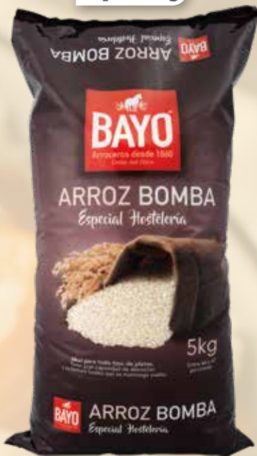
Ref.: 2711000031 BAYO Arròs bomba 5 kg