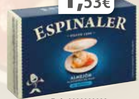
Ref.: 0000000032 Cloïsses gran al natural OL120 F.O.