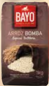
Ref.: 2711004100 BAYO Arròs bomba 1 kg