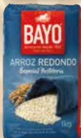
Ref.: 2711001121 BAYO Arròs extra 1 kg