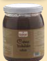
Ref.: 1100001046 BOVIS Crema de tòfona negra 500 g