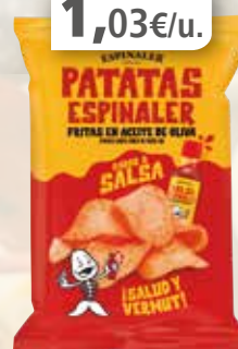
Ref.: 5002000029 Patates fregides amb oli d'oliva sabor salsa Espinaler 50 g 25 u.