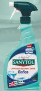
Ref.: 7723000070 SANYTOL Netejador desinfectant banys polvoritzador 750 ml