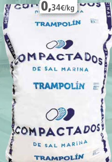
Ref.: 2101000023 TRAMPOLÍN Sal descalcificadora en pastilles 25 kg