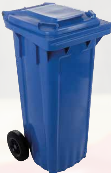
Ref.: 8394000014 Contenidor mòbil blau amb tapa 93,5 x 45 x 51,5 cm 80 l