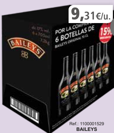
Ref.: 1100001529 BAILEYS Crema de whisky 70 cl 6 u. + 15% dte.