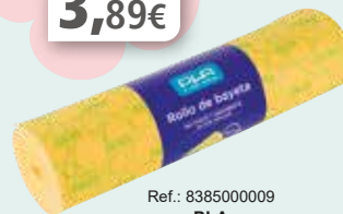
Ref.: 8385000009 PLA Baieta groga en rotlló 40 x 600 cm