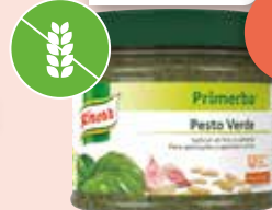
Ref.: 1100001663 KNORR Primerba pesto verde 340 g