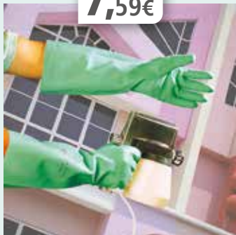
Ref.: 8385000017 RUBBEREX Guants de nitril flocat talla "M" parell