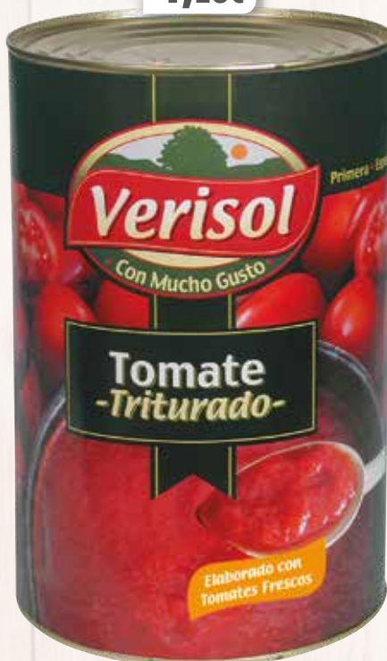
Ref.: 2507000500 VERISOL Tomàquet triturat 5 kg