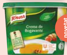
Ref.: 1100001678 KNORR Crema de llamàntol deshidratada 375 g 25 racions