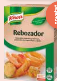
Ref.: 1100001664 KNORR Preparat deshidratat per arrebosar 1,8 kg