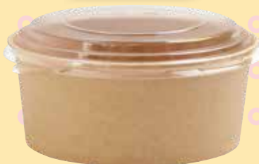
Ref.: 1100001594 Enciamera kraft + tapa PET 700 ml. 15 x 6 cm 25 u.