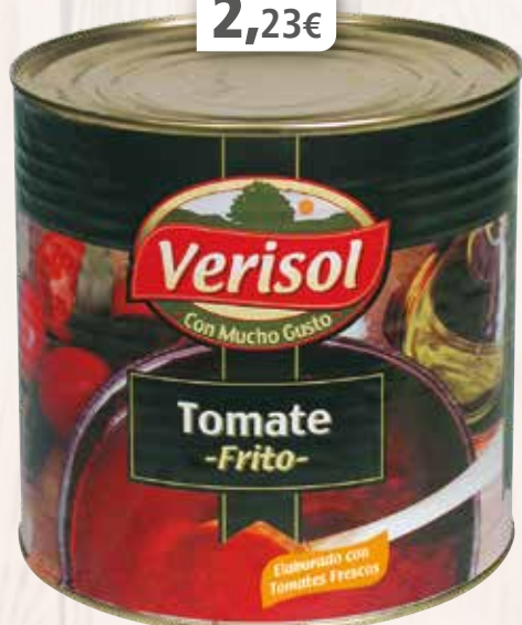
Ref.: 2507050303 VERISOL Tomàquet fregit 3 kg