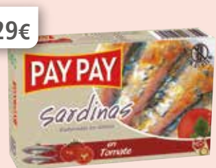
Ref.: 256100009 PAY PAY Sardines en tomàquet RR125, F.O.