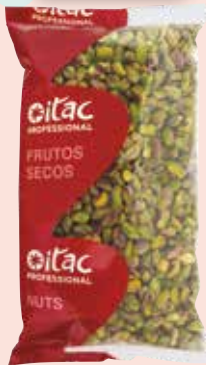
Ref.: 5001000019 ITAC Festucs pelats crus 1 kg