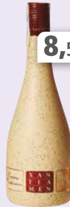
Ref.: 1140423400 XANTIAMEN Limonciño 70 cl