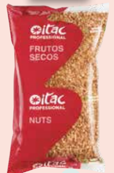
Ref.: 5001000008 ITAC Ametlles crocant en daus 1 kg