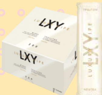
Ref.: 7401000055 LUXURY WIPE Tovallolletes amb aroma neutra 200 u.