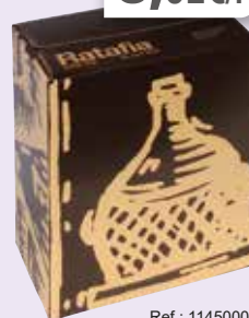
Ref.: 1145000047 RUSSET Ratafia "bag in box" amb aixeta 3 l