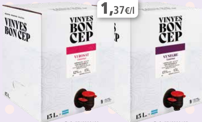
Ref.: 0715000106 VINYES BON CEP Vi de taula rosat "bag in box" amb aixeta 15 l