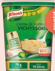
Ref.: 1100001680 KNORR Crema de porros Vichyssoise deshidratada 700 g 50 racions