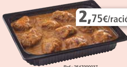
Ref.: 2547000037 CARRETTILLA Galtes en salsa 1,9 kg 2 u.