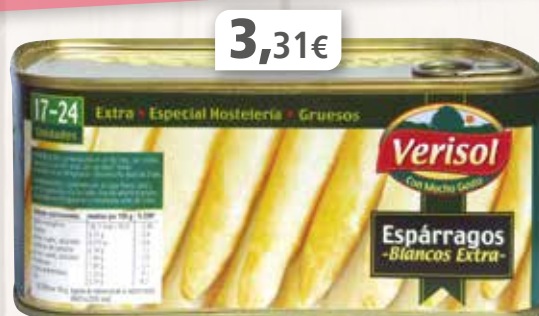
Ref.: 2517001103 VERISOL Espàrragos blancs extra 17/24, 1 kg