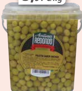
Ref.: 1100000883 ACEITUNAS REDONDO Olives pelotín anxovada 2,75 kg