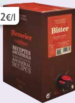
Ref.: 1100000665 REMEIER Bitter "bag in box" amb aixeta 5 l