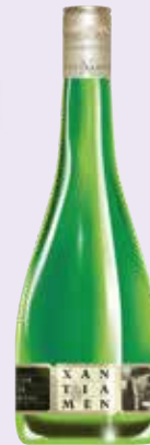
Ref.: 1140373400 XANTIAMEN Licor d'herbes 70 cl