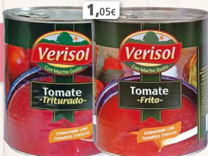
Ref.: 250900013 VERISOL Tomàquet triturat 1 kg

APROFITA LES OFERTES QUE TENIM DISPONIBLES AQUEST MES!!!