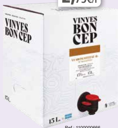
Ref.: 1100000666 VINYES BON CEP Vi ranci "bag in box" amb aixeta 15 l