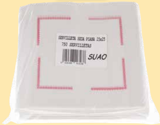
Ref.: 7401000030 SUAO Tovallons de seda plana per a entrepans 25 x 25 cm 750 u.