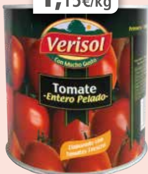
Ref.: 2507000030 VERISOL Tomàquet sencer pelat 3 kg