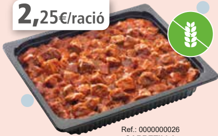
Ref.: 000000026 CARRETTILLA Magre de porc 1,8 kg 2 u.