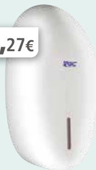
Ref.: 8389000015 GC Dosificador de gel automàtic 250 x 126 x 107 mm 900 ml