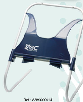
Ref.: 8389000014 GC Dispensador de cel·lulosa mural/sobretaula metàl·lic blanc 420 x 400 x 380 mm