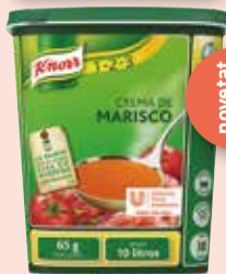
Ref.: 1100001679 KNORR Crema de marisc deshidratada 650 g 50 racions