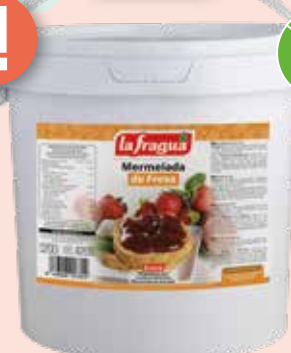
Ref.: 1100001353 LA FRAGUA Mermelada de maduixa 4,2 kg