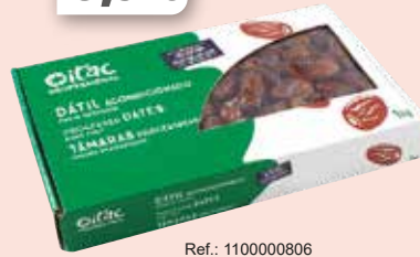
Ref.: 1100000806 ITAC Dàtils sense pinyol bàsic 1 kg