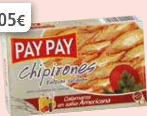
Ref.: 2555010102 PAY PAY Calamarsets en salsa Americana OL120 F.O.