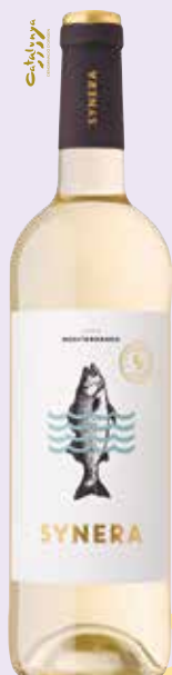
Ref.: 0800000061 SYNERA Vi blanc jove D.O. Catalunya 75 cl