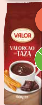
Ref.: 1100001684 VALOR Valorcao xocolata a la tassa 1 kg