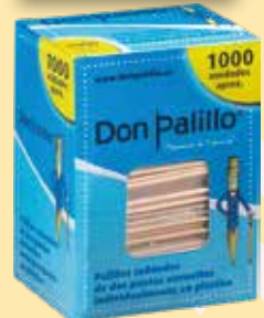
Ref.: 8351020000 DON PALILLO Escrudants envasats 1000 u.