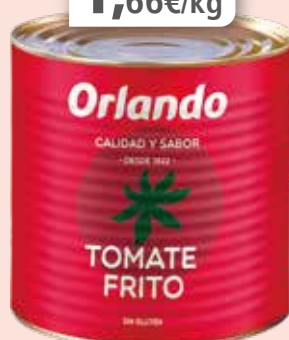
Ref.: 2507092603 ORLANDO Tomàquet fregit 2,65 kg