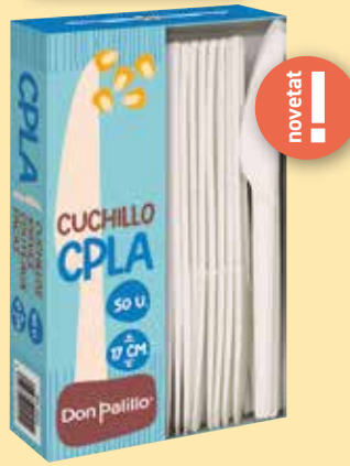
Ref.: 1100001627 DON PALILLO Ganivet de CPLA 100% biodegradable 17 cm 50 u.

EL CPLA és un material compostable i reutilitzable, elaborat a partir de materials compostables derivats de fonts vegetals. Són una alternativa ecològica que té la facilitat de desintegrar-se fàcilment en el medi ambient sense conseqüències negatives.