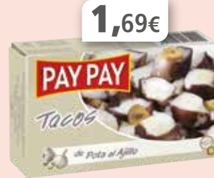
Ref.: 2555010103 PAY PAY Pop en daus en oli vegetal OL120 F.O.