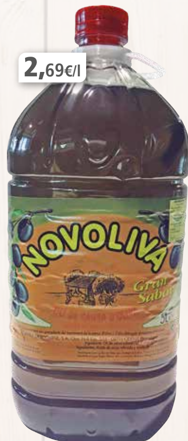
Ref.: 1905920507 NOVOLIVA Aceite de orujo 5 l