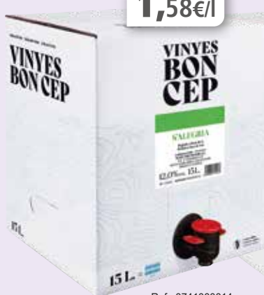
Ref.: 0741000014 VINYES BON CEP S'Alegria beguda base de vi blanc "bag in box" amb aixeta 15 l