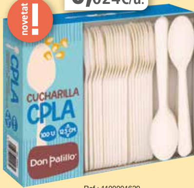
Ref.: 1100001629 DON PALILLO Cullereta de CPLA 100% biodegradable 12,5 cm 100 u.