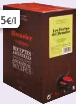
Ref.: 1100000661 REMEIER Licor d'herbes "bag in box" amb aixeta 5 l