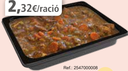
Ref.: 2547000008 CARRETTILLA Vedella jardineria 2 kg 2 u.