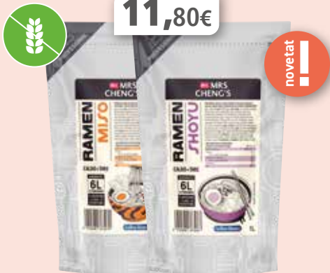
Ref.: 1100001661 o 1100001662 GALLINA BLANCA Preparat líquid concentrat amb salsa de soja i vi d'arròs per elaboració de brou tipus ramen