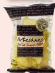
Ref.: 5010000002 ARTESANES Patates fregides amb un 30% d'oli d'oliva 60 g 18 u.