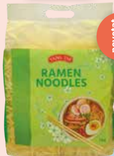
Ref.: 1100001712 YANG-TSE Ramen noodles 1 kg