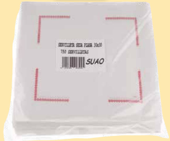
Ref.: 7401000031 SUAO Tovallons de seda plana per a entrepans 30 x 30 cm 750 u.