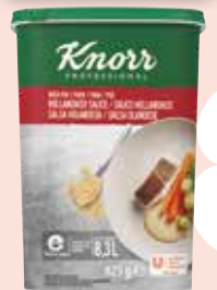
Ref.: 1100001658 KNORR Salsa holandesa deshidratada 825 g 208 racions