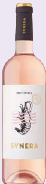
Ref.: 0800000058 SYNERA Vi rosat jove D.O. Catalunya 75 cl