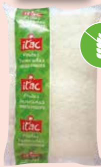
Ref.: 5001104121 ITAC Coco ratllat 1 kg