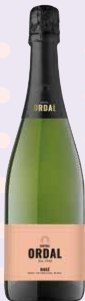
Ref.: 0901020100 CASTELL D'ORDAL Vi escumós rosat semi sec 75 cl 6 u.