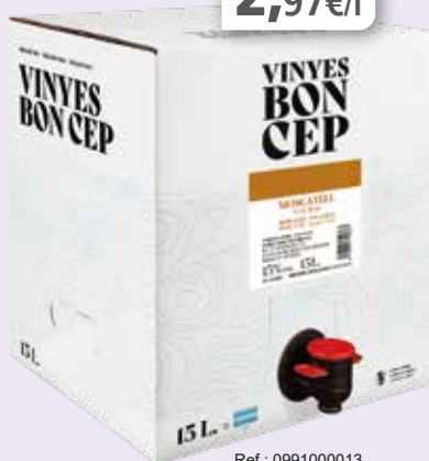
Ref.: 0991000013 VINYES BON CEP Moscatell "bag in box" amb aixeta 15 l