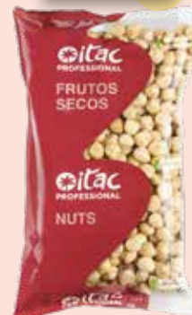
Ref.: 5001484121 ITAC Avellanes repelades i torrades 1 kg