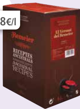
Ref.: 1100000663 REMEIER Vermut negre "bag in box" amb aixeta 5 l