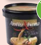
Ref.: 1100000780 ANTIUXIXONA Crema de torrò per a untar 350 g