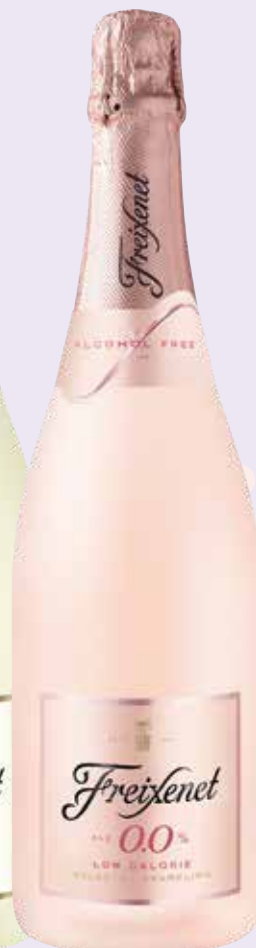
Ref.: 0722000003 FREIXENET Beguda escumosa rosat sense alcohol 75 cl