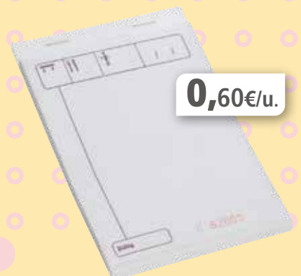
Ref.: 8390000001 Bloc per a comandes amb 1 còpia 10 x 15 10 u.