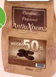
Ref.: 1100000774 ANTIUXIXONA Gotes de xocolata negra 50% 1 kg