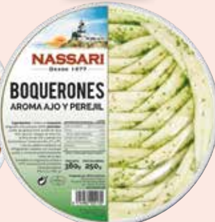
Ref.: 2557000013 NASSARI Seitons amb aroma d'all i julivert 360 g