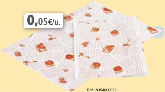
Ref.: 8354000029 QUID Paper antigreix per a presentació 31 cm 100 u.