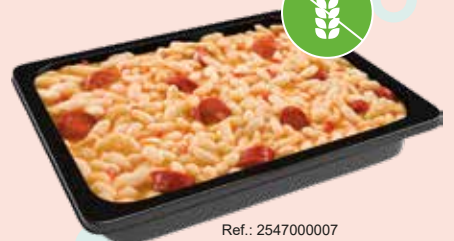
Ref.: 2547000007 CARRETTILLA Mongetes amb xoriço 1,8 kg 2 u.