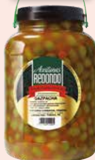
Ref.: 2303032718 ACEITUNAS REDONDO Olives Gaspatxa 2,5 kg