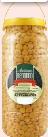
Ref.: 2311170318 ACEITUNAS REDONDO Tramussos remullats 2,75 kg