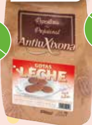
Ref.: 1100000775 ANTIUXIXONA Gotes de xocolata amb llet 1 kg