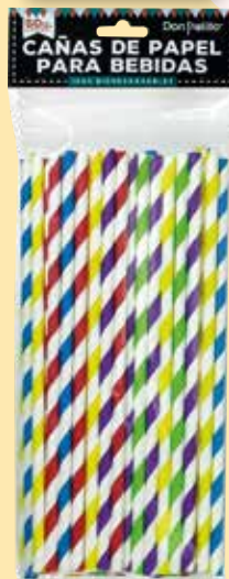
Ref.: 8351000058 DON PALILLO Canyes biodegradables espirals de colors 6 x 200 mm 50 u