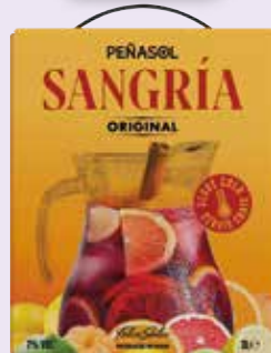
Ref.: 0741000004 PEÑASOL Sangria "bag in box" 3 l