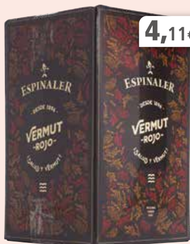
Ref.: 1100000460 ESPINALER Vermut negre "bag in box" amb aixeta 10 l