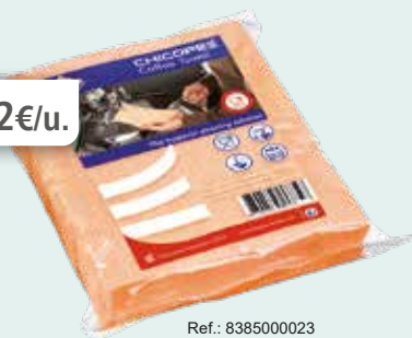
Ref.: 8385000023 CHICOPEE Baieta especial màquines de cafè 43 x 32 cm 10 u.