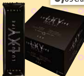
Ref.: 7721000009 LUXURY WIPE Tovallolletes amb aroma a llimona 200 u.