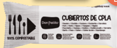
Ref.: 1100001630 DON PALILLO Set n°1 coberts de CPLA (forquilla + ganivet + cullera + cullereta + tovallons) 100% biodegradable 25 u.