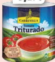
Ref.: 2507000025 CARRETTILLA Tomàquet triturat 1 kg