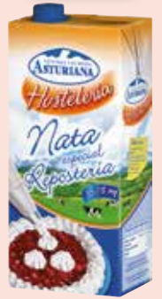
Ref.: 0521000007 CENTRAL LECHERA ASTURIANA Nata per a muntar especial hostaleria 35% mg 1 l