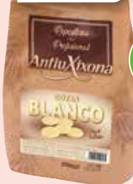
Ref.: 1100000776 ANTIUXIXONA Gotes de xocolata blanca 1 kg