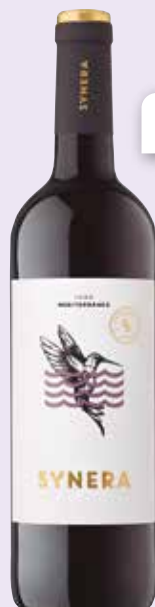
Ref.: 0800000063 SYNERA Vi negre jove D.O. Catalunya 75 cl