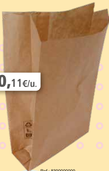
Ref.: 8390000009 Bossas kraft 14 x 24 x 7 cm 1000 u.