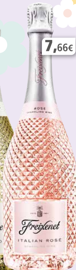
Ref.: 0721000015 FREIXENET Italian rosé vi escumós 75 cl