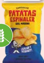
Ref.: 1100000443 ESPINALER Patates fregides amb sal marina 50 g 25 u.