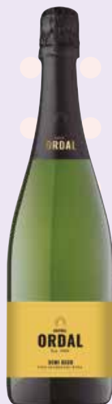
Ref.: 0901030100 CASTELL D'ORDAL Vi escumós Extra semi sec 75 cl 6 u.