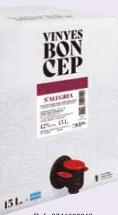
Ref.: 0741000010 VINYES BON CEP S'Alegria sangria negra "bag in box" amb aixeta 15 l