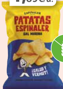
Ref.: 1100000444 ESPINALER Patates fregides amb sal marina 150 g 10 u.