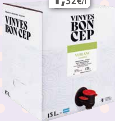
Ref.: 0715000105 VINYES BON CEP Vi de taula blanc "bag in box" amb aixeta 15 l