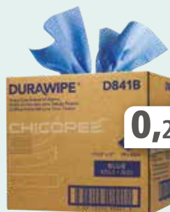
Ref.: 7409000012 CHICOPEE Durawipe plus drap blau 1 capa 29 x 43 cm 168 u.