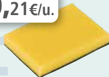
Ref.: 8383000001 PLA Fregall verd + esponja 2,5 x 10 x 15 cm 20 u.