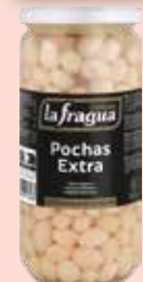
Ref.: 1100001469 LA FRAGUA Deluxe mongetes "pochas" cuites 720 ml