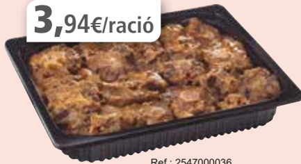
Ref.: 2547000036 CARRETTILLA Cua de bovi amb salsa 2 kg 2 u.

Per la compra de 2 caixes, REGAL d'1 caixa de mongetes amb xoriço