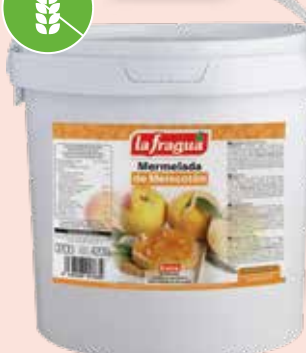
Ref.: 1100001351 LA FRAGUA Mermelada de préssec 4,2 kg