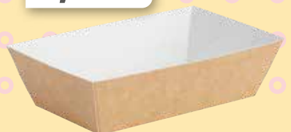
Ref.: 1100001589 Safata kraft rectangular per a fregits 11,5 x 7 cm 100 u.