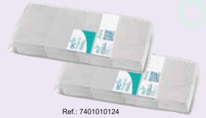
Ref.: 7401010124 GC ORIGINAL Tovallons blancs mini-serveis 1 capa 17 x 17 cm 400 u.

Per la compra de 6 amp. assortides, REGAL de 2 paquets de mini-serveis