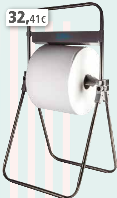
Ref.: 8389000022 GC ECOLOGIC+ Dispensador de cel·lulosa de peu inoxidable 400 x 350 x 790 mm