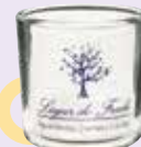
Ref.: 1100000397 Got xarrup 6 u.

Per la compra de 2 garrafes, REGAL de 6 gots de xarrup