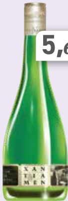
Ref.: 1140363400 XANTIAMEN Licor d'orujo blanc 70 cl