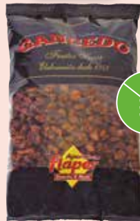
Ref.: 5001000054 GANCEDO Panses sultanes 1 kg