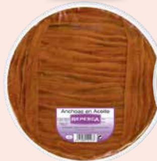
Ref.: 2557040201 REPESCA Anxoves en oli de gira-sol 100 filets