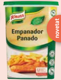
Ref.: 1100001665 KNORR Preparat per a empanar 1 kg