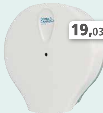
Ref.: 8389000025 GC ECOLOGIC+ Dispensador industrial 100% reciclat dispensació controlada de paper higiènic

FORA ESTOC (fins a exhaurir existències)