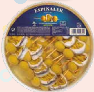
Ref.: 1100001112 ESPINALER Gildas de seitons en oli 24 u. 620 g