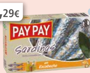
Ref.: 256100008 PAY PAY Sardines en escabetx RR125, F.O.