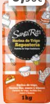
Ref.: 1100001177 SANTA RITA Farina per a rebosteria 1 kg