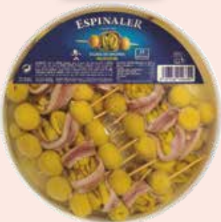
Ref.: 1100001113 ESPINALER Gildas d'anxova en oli 24 u. 620 g