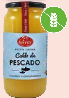
Ref.: 2777000071 FERRER Brou de peix 940 ml