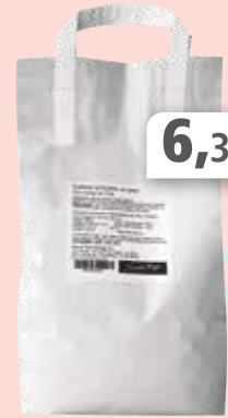
Ref.: 2709090024 VERISOL Canelons 1000 plaques 334 racions