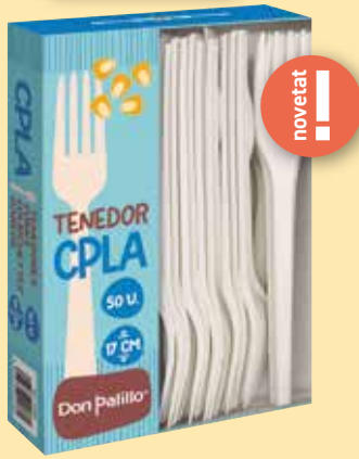
Ref.: 1100001623 DON PALILLO Forquilla de CPLA 100% biodegradable 17 cm 50 u.