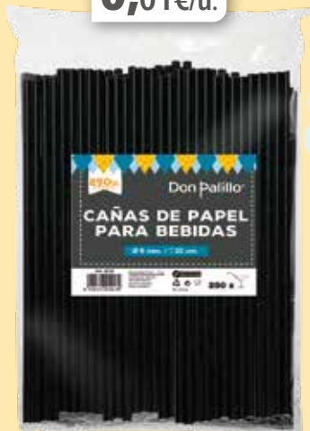
Ref.: 8351000062 DON PALILLO Canyes negre 6 x 200 mm 250 u.