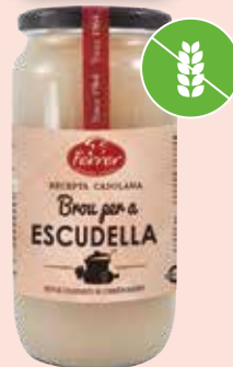
Ref.: 2777000072 FERRER Brou per a escudella 940 ml