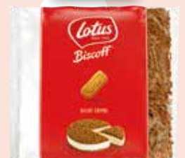
Ref.: 0000000002 LOTUS Biscoff "crumble" galeta triturada 750 g